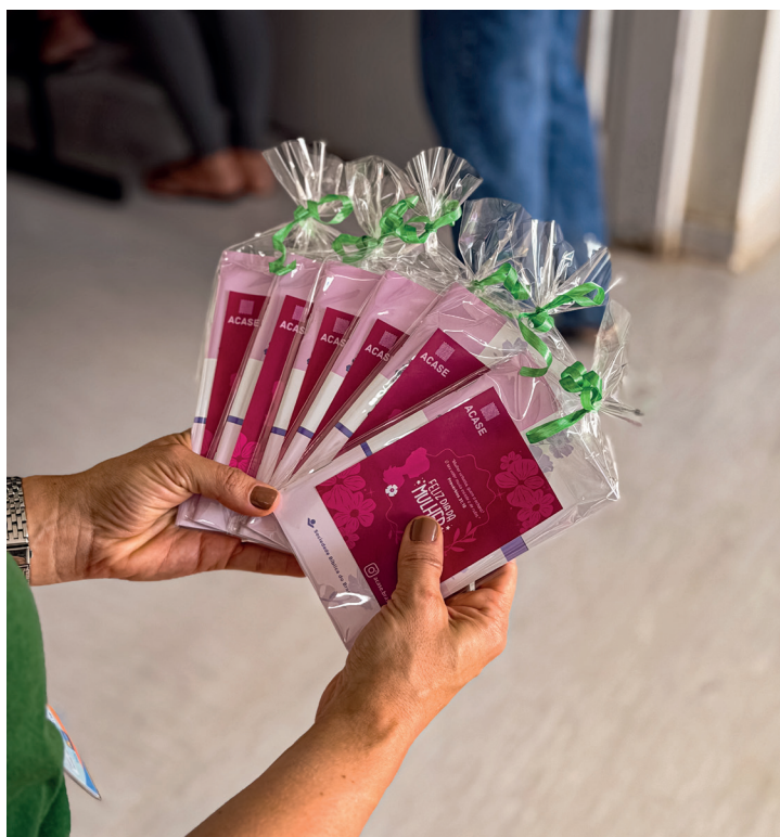
Todas as mulheres foram presenteadas com lembrancinha ao final do culto