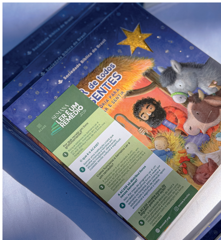
Todos os livros distribuídos acompanhavam um marcador de página sobre a Semana