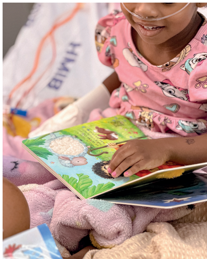
Semana Ler é um remédio distribuído livros para todas as idades