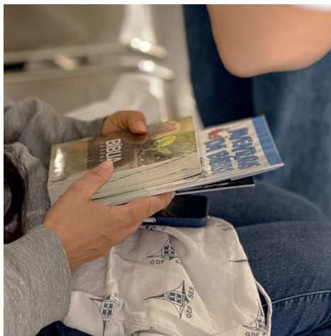
Para a longa espera nos bancos do hospital, livros que transformam a vida

de uma parceira frequente da ACASE: a Sociedade Bíblica do Brasil , responsável pela doação de mais de mil livros, o que possibilitou a ampliação do alcance da ação neste ano.