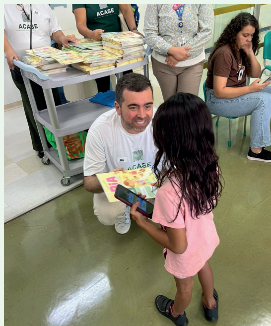
Presidente da ACASE distribuiu às crianças livros de sua autoria

Disto não há dúvidas: a ACASE continuará com o programa Ler é um remédio e, anualmente, com a Semana que tem abençoado milhares de vidas. Continuará, pretende-se, inclusive no HCB, se estas portas continuarem gentilmente se abrindo para nós.