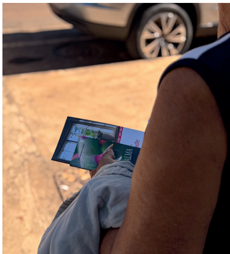
Parceria da ACASE com Sociedade Bíblica do Brasil garantiu a ampla distribuição

destacou o valor do presente recebido: “Eu recebi uma Bíblia e um livro de mensagens curtas que, já no ônibus, voltando para casa, li quase metade. Saí do hospital muito triste com o que ouvi dos médicos, mas a leitura do livro renovou as minhas esperanças e aumentou a minha fé”.