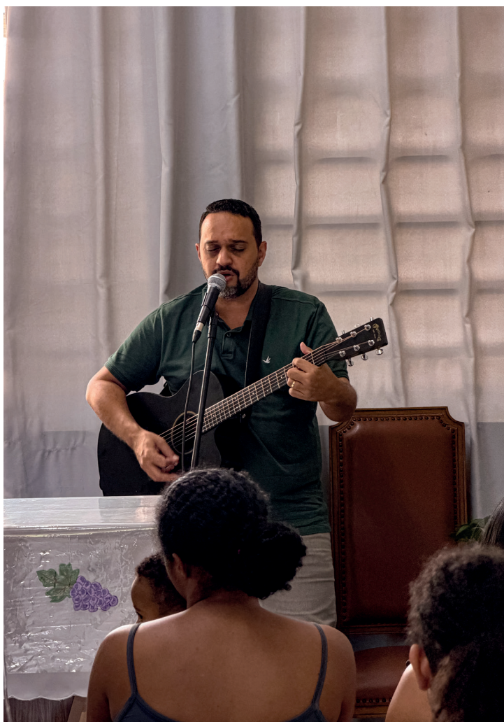
Momento de louvor e adoração no hospital