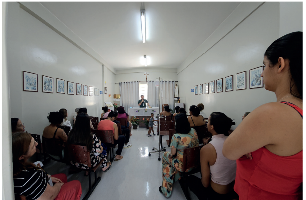
Capela cheia para ouvir a Palavra de Deus

Desde o início do culto, iniciado às 10 horas, os bancos da capela foram sendo preenchidos por mulheres que vivem, naquele espaço, momentos delicados de suas vidas. Mães e avós compareceram acompanhadas de seus filhos e netos, muitos deles ainda em tratamento. Algumas crianças chegaram à capela carregando o próprio suporte de soro móvel, uma cena que evidenciava, ao mesmo tempo, a fragilidade