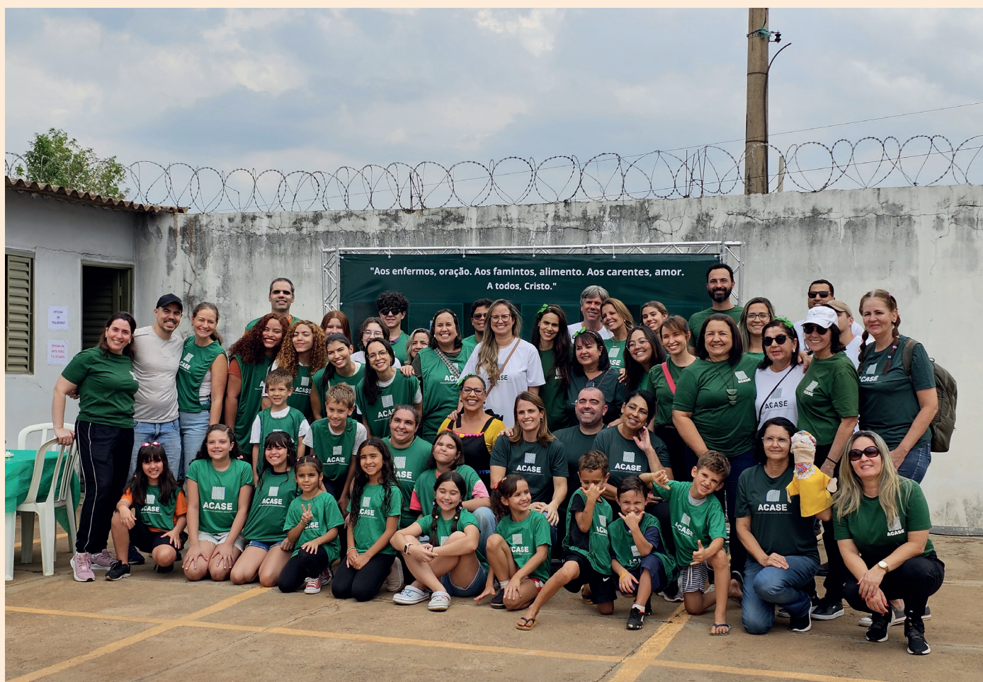
Com outro nome, mas mantendo o mesmo ACASE e a mesma missão de sempre