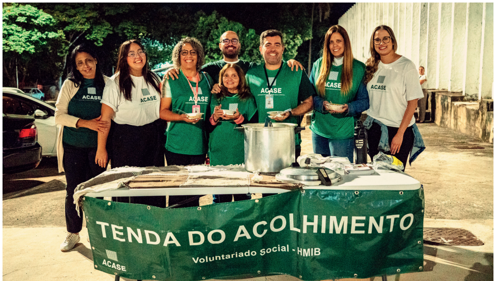
Mesa Acolhedora é uma das novidades que o Relatório de 2025 traz

Os resultados apresentados no Relatório de Atividades 2025 refletem o compromisso da ACASE com