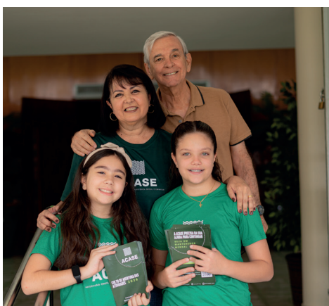
Voluntários da Acase - alegria em servir ao Senhor