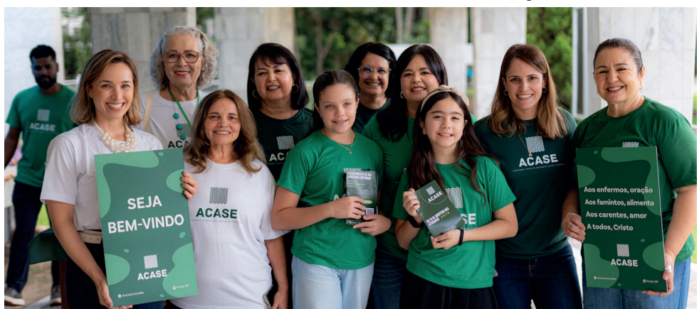
Voluntários da Acase animados para a manhã de adoração a Deus