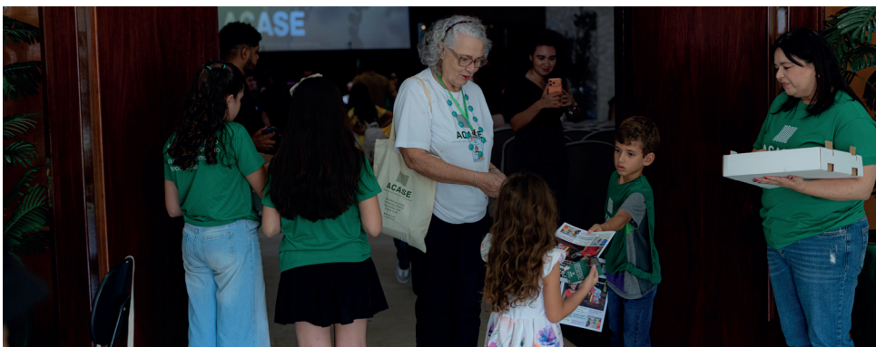
Despedida adocicada pelos deliciosos brigadeiros da Confeitaria Dona Zuca