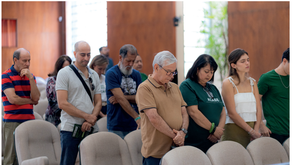
Presentes oraram a Deus em prol do trabalho da Acase