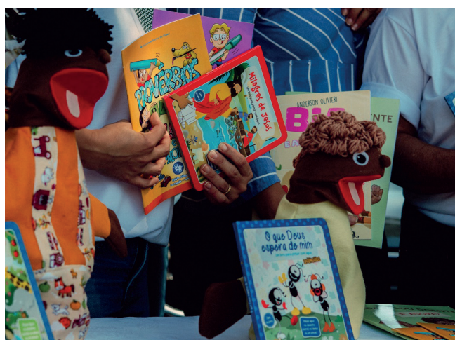
Fantoches foram excelentes atrativos para entrega dos livros às crianças