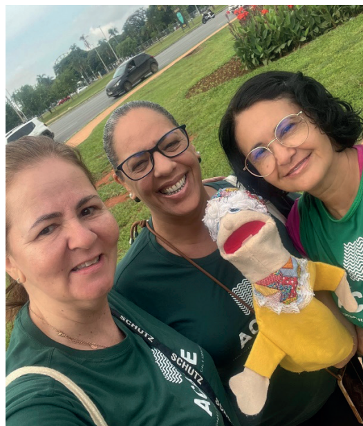
Voluntários participantes da distribuição das mini Bíblias