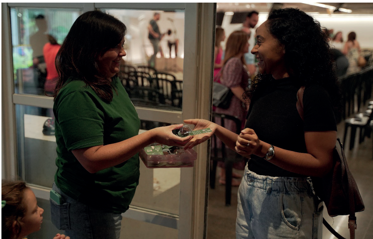
Despedida adoçada com brigadeiro