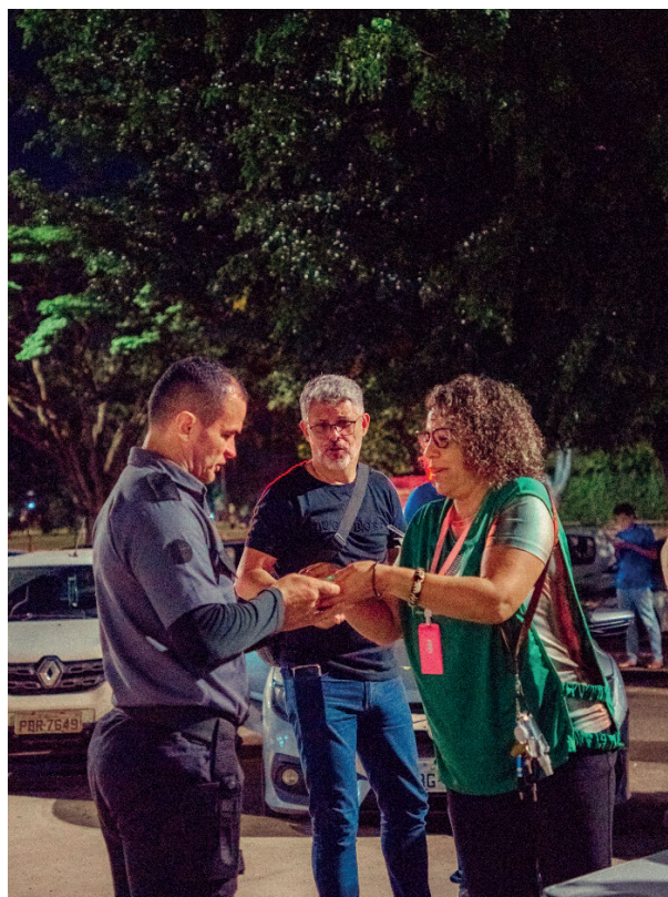
Acolher, além de estar presente, é servir, orar e amar