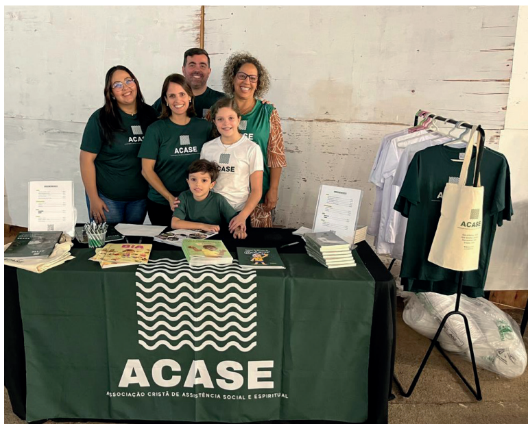
Parte do time de voluntários que serviu no dia da apresentação à Igreja