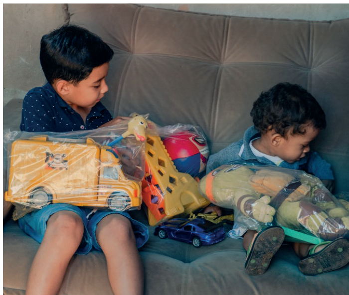
As crianças recebem presentes nas visitas do Casa de Jairo