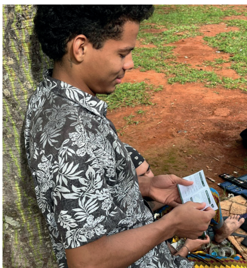
Muitos recebiam a mini Bíblia e já iniciavam a leitura