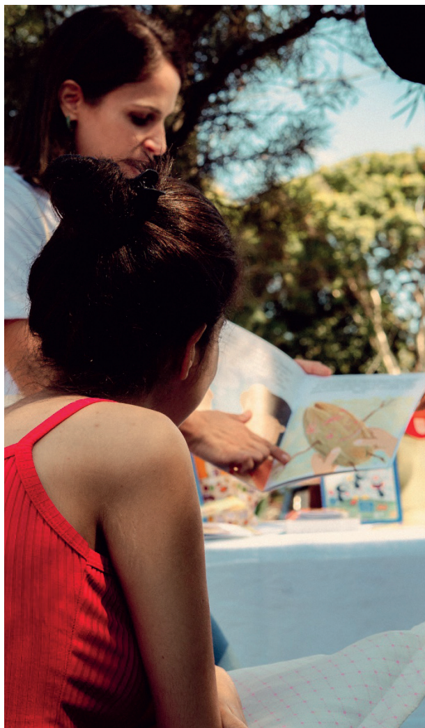
Durante a ação, houve contação de histórias