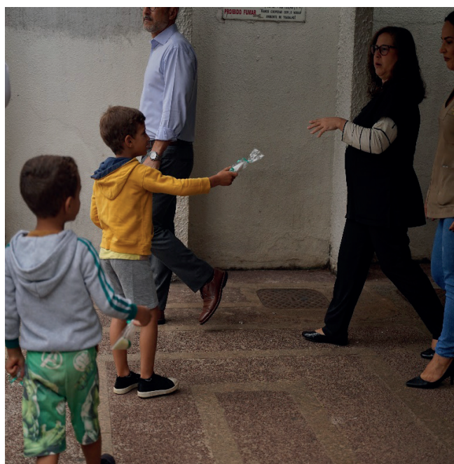
Voluntários mirins da ACASE participaram da distribuição