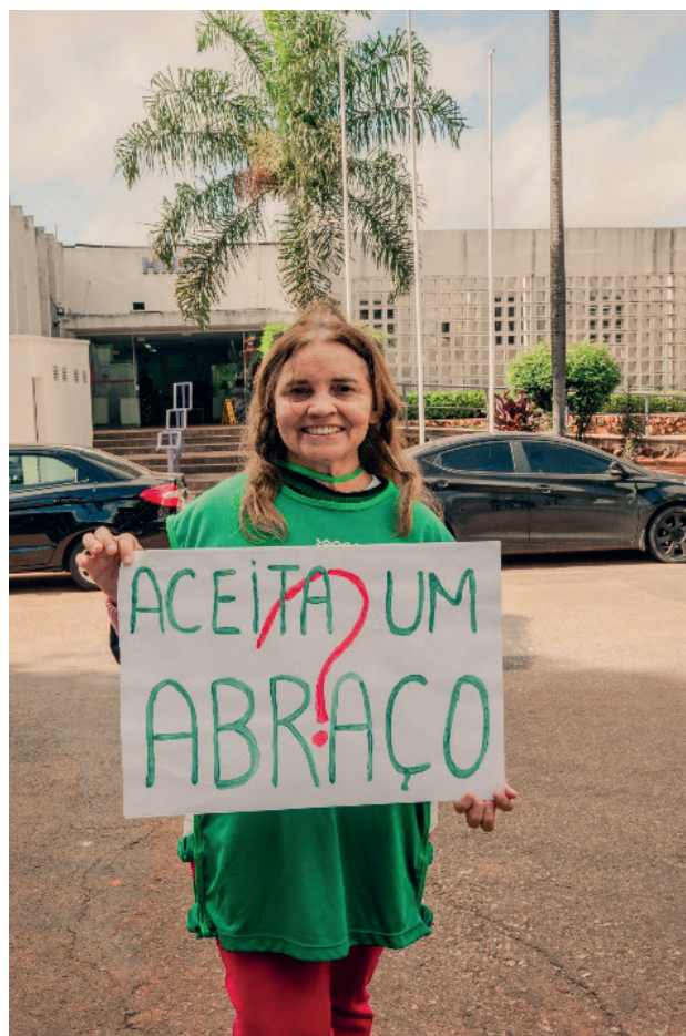
Voluntários de braços abertos para o melhor abraço