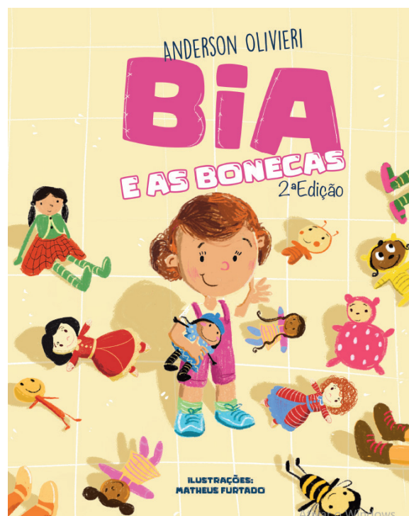
Capa do livro