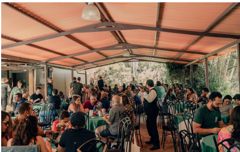
Feijoada Solidária arrecadou fundos e promoveu comunhão