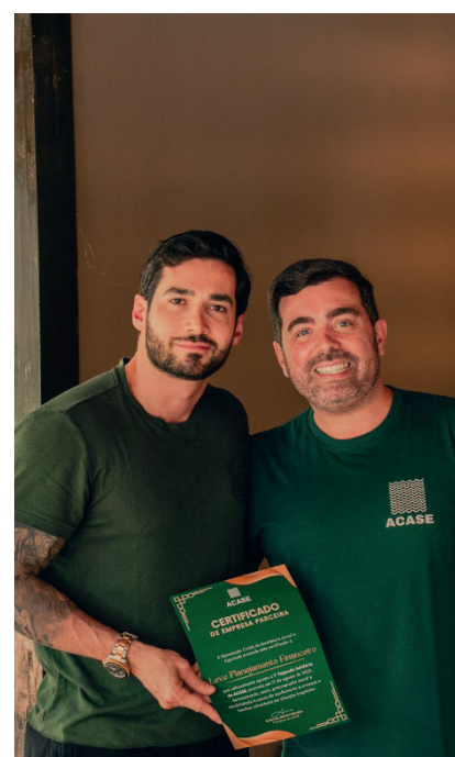
Patrocinadores certificados como parceiros da ACASE