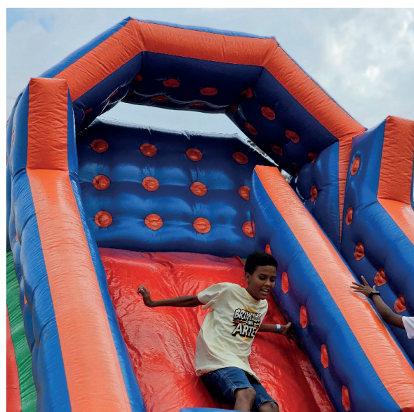
Muitas opções de diversão e brincadeiras