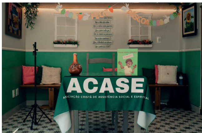
Tudo preparado com muito carinho pela Dona Zuca