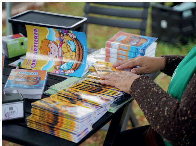
Triagem para distribuição dos livros