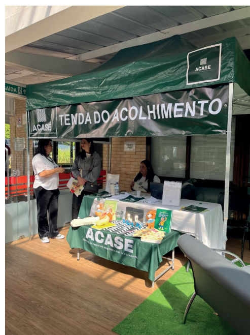
Manhã produtiva e de muita divulgação a respeito dos trabalhos da ACASE