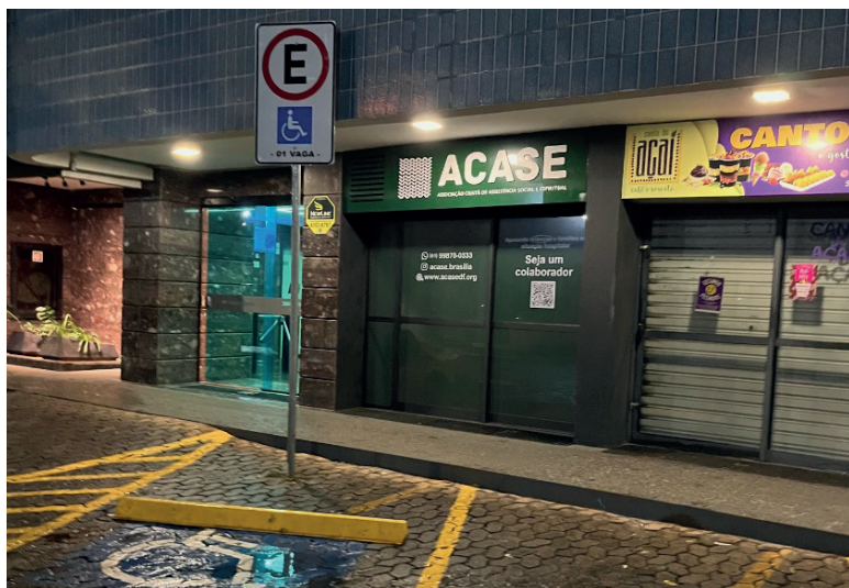
Sede da ACASE está localizada em ponto estratégico do edifício

O local funciona como ponto de recebimento de doações para famílias carentes e como sede administrativa da ACASE, o que a torna o principal local de reunião da diretoria da entidade, facilitando assim a coordenação e o planejamento de ações assistenciais. O local também dispõe de um pequeno espaço, chamado Lojinha da ACASE , para a venda de itens personalizados.