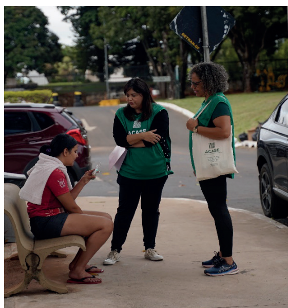
Na porta dos hospitais, a ACASE é um ombro amigo para os que sofrem