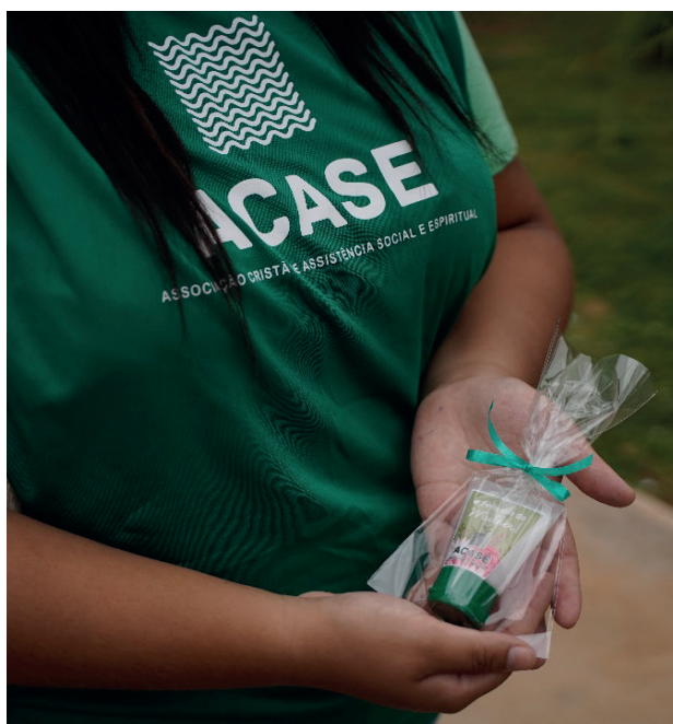
Mimo personalizado da Acase recebido pelas mulheres