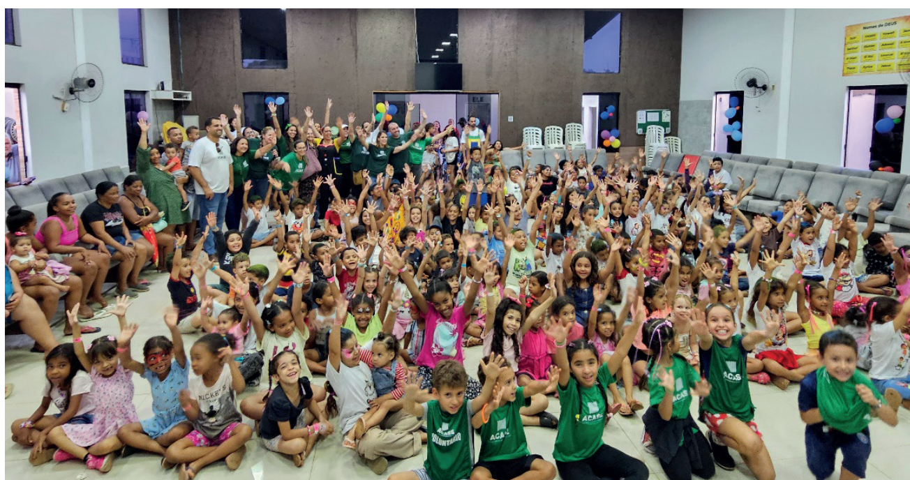
Todos os participantes do Dia das Crianças da ACASE