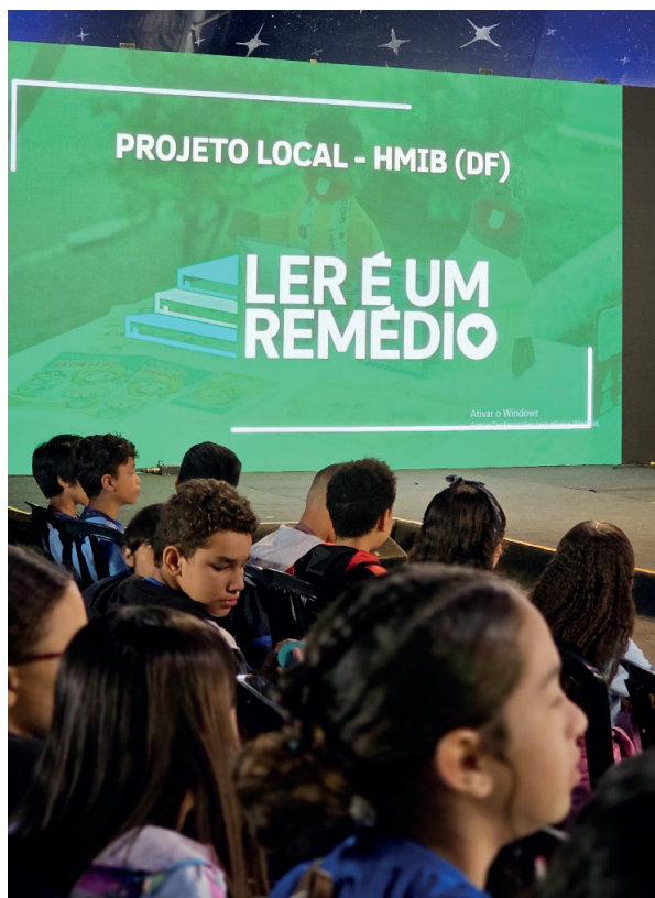
Palestra prestigiada por ouvintes mirins