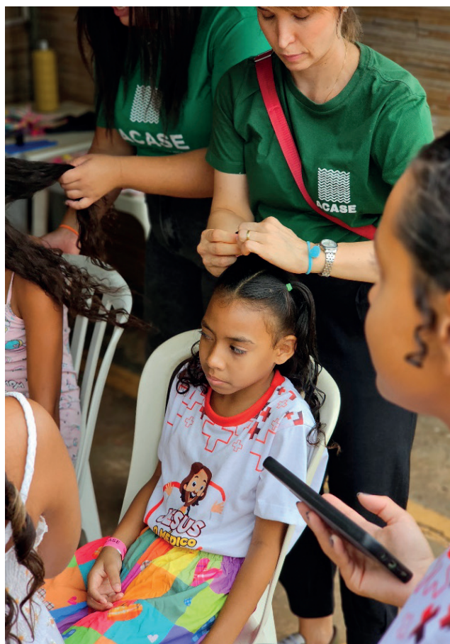
Oficinas temáticas, como de penteados, também foram atração