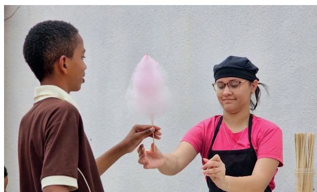
Não faltaram opções de sabores apreciados pelas crianças