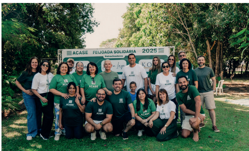
Voluntários responsáveis por fazer a Feijoada Solidária acontecer