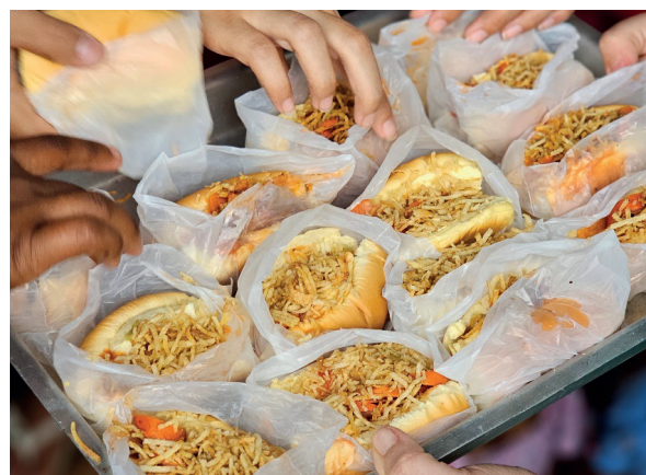
Cachorro-quente das voluntárias, feito com carinho e capricho, fez sucesso