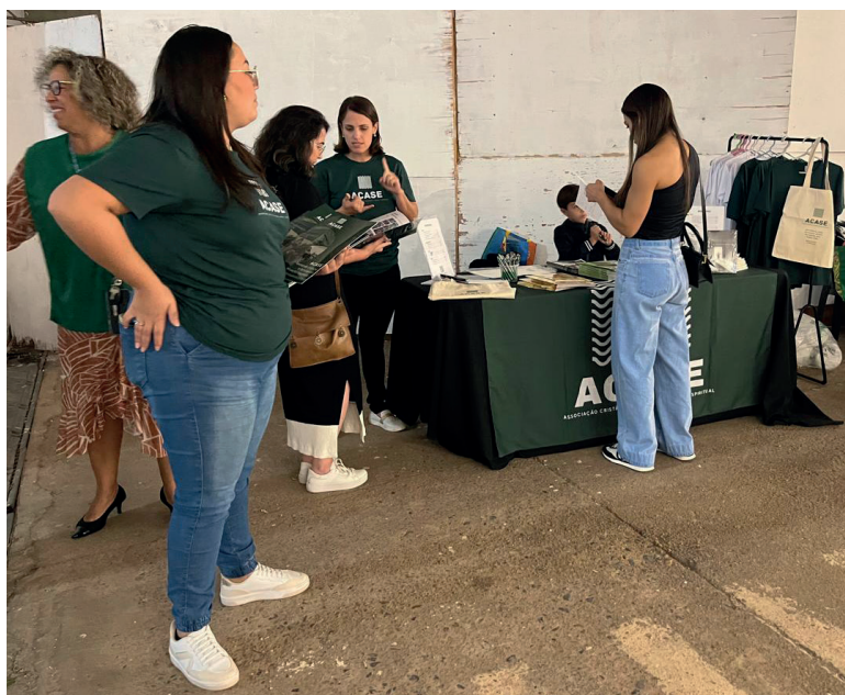
Banquinha da ACASE disponível para mais informações e venda de itens

A partir de junho de 2025, a ACASE se tornou um ministério para-eclesiástico apoiado espiritualmente pela igreja Batista Vértice, em Brasília. Esse vínculo se deu a partir da avaliação da diretoria da ACASE de que o ministério carecia de uma igreja-mãe que desse suporte de oração e apoio espiritual à instituição. Ao conhecer em detalhes o trabalho da ACASE, a diretoria da Batista Vértice comprometeu-se com esse apoio e, inclusive, em 22 de junho, convidou a liderança da instituição a compartilhar com os membros da igreja o testemunho que deu causa à fundação da ACASE e a divulgar o trabalho realizado nos hospitais aos irmãos.