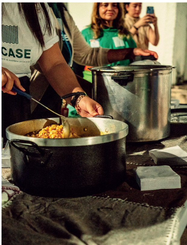
Refeição preparada e servida com carinho pelos voluntários

Durante a distribuição, os voluntários da ACASE aproveitam para oferecer também orações, abraços e escuta ativa aos pacientes em espera.