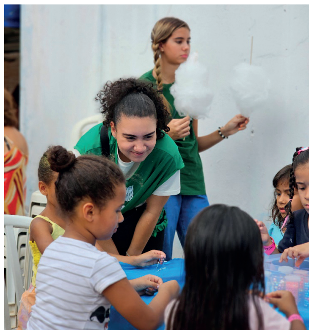
Interagir com as crianças e fazê-las se sentirem amadas foram imperativos da tarde