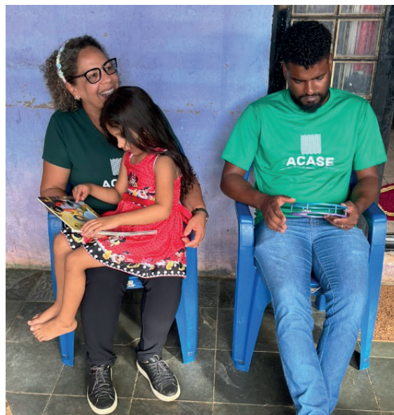
Acolher também é sentar, ouvir, ler junto e estar presente