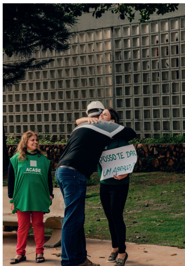
Abraço em ação