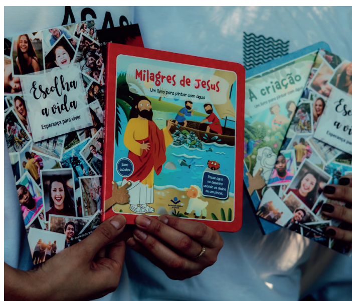
Programa Ler é um remédio é rigoroso com literatura de qualidade