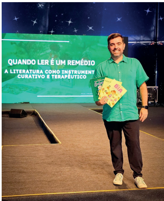
Palestrante exhibe os seus livros