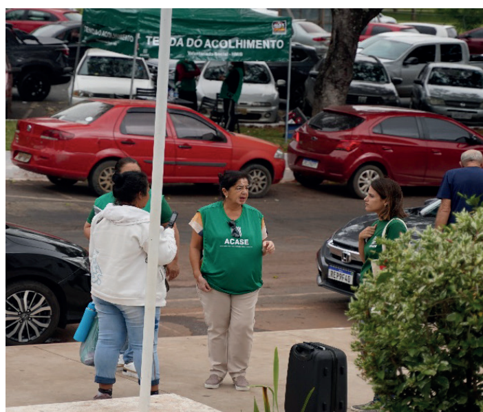
Tenda do Acolhimento: ponto de apoio emocional e espiritual nos hospitais