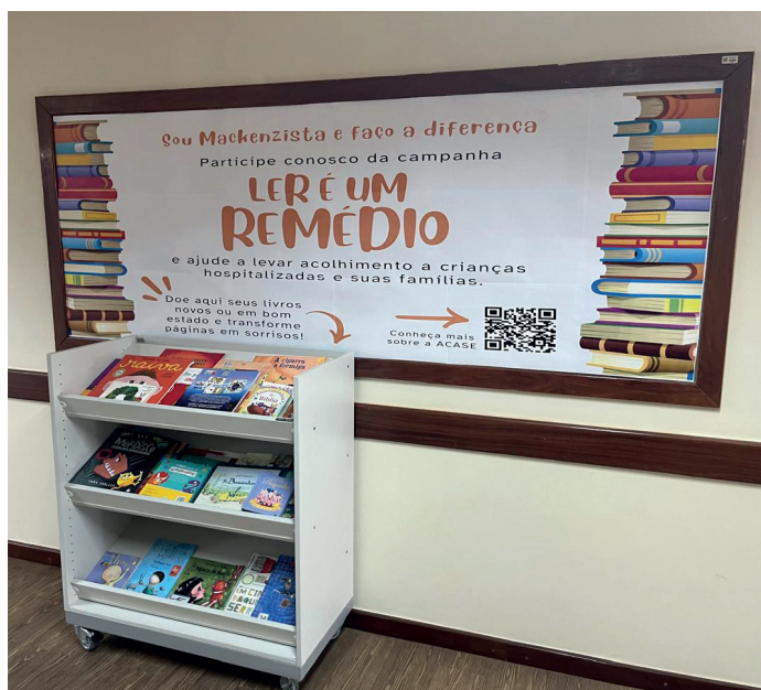
Mural das crianças de incentivo à doação de livros

Nesse dia, também foi feita a entrega solene dos 540 livros arrecadados pela Educação Infantil do Mackenzie (doação dos próprios alunos), para o programa Ler é um remédio , da ACASE.