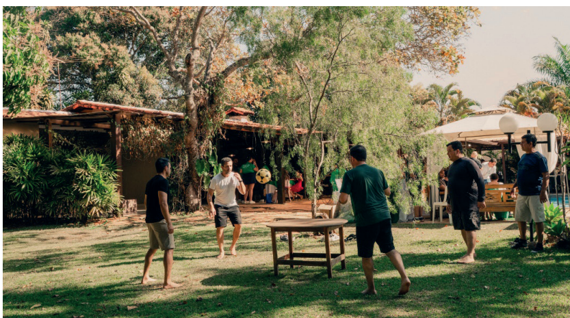
Muito lazer disponível, com piscina, futebol e futmesa