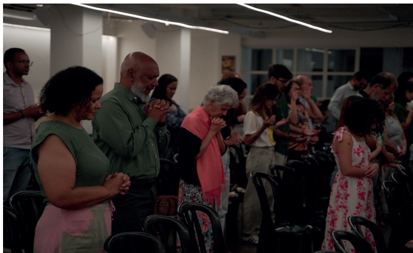
Tempo importante de oração e adoração