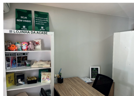
A Lojinha da ACASE é uma das atrações do espaço