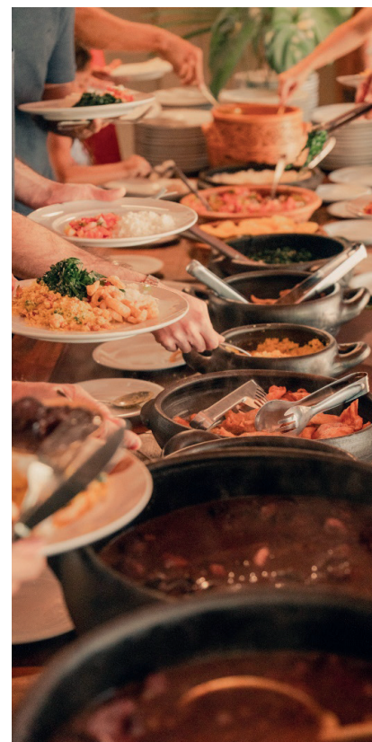
Feijoada completinha e caprichada