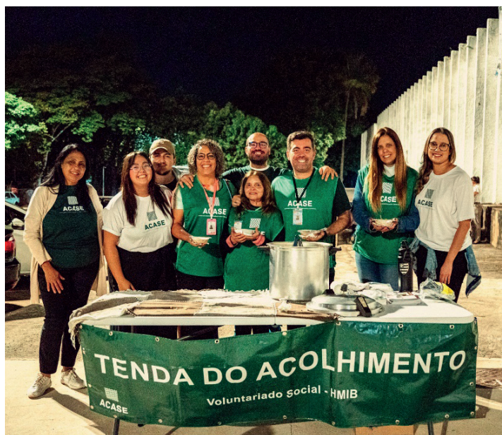
Time que serve, ouve e acolhe