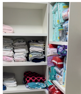
Local dispõe de bastante espaço para doações