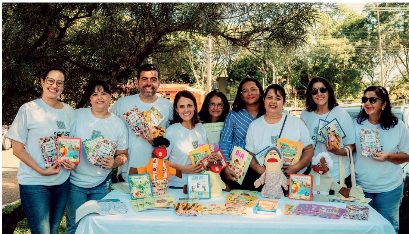
Voluntários da Tenda na Semana Ler é um remédio

Esse resultado positivo foi alcançado graças, também, à parceria da ACASE com a Sociedade Bíblica do Brasil (SBB) , que doou mais de 1.500 livros ao longo do ano, para a nossa instituição, a fim de nos abastecer para as ações do programa.