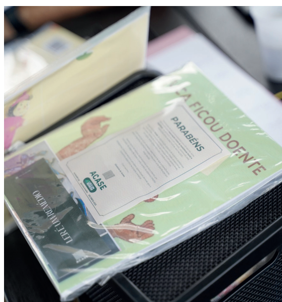
Kit leitura: livro infantil, marcador de página e cartela de adesivos