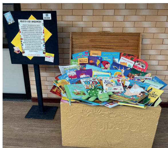
Resultado das doações: 540 livros destinados ao programa Ler é um remédio