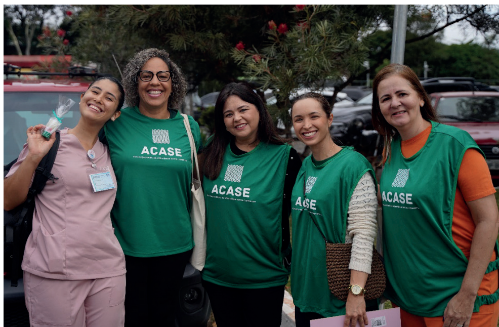
Voluntárias mulheres presenteiam funcionária do hospital