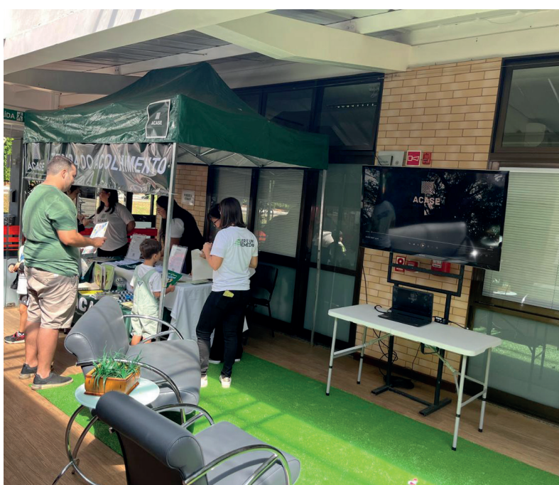
Stand da ACASE para os visitantes da Feira Literária