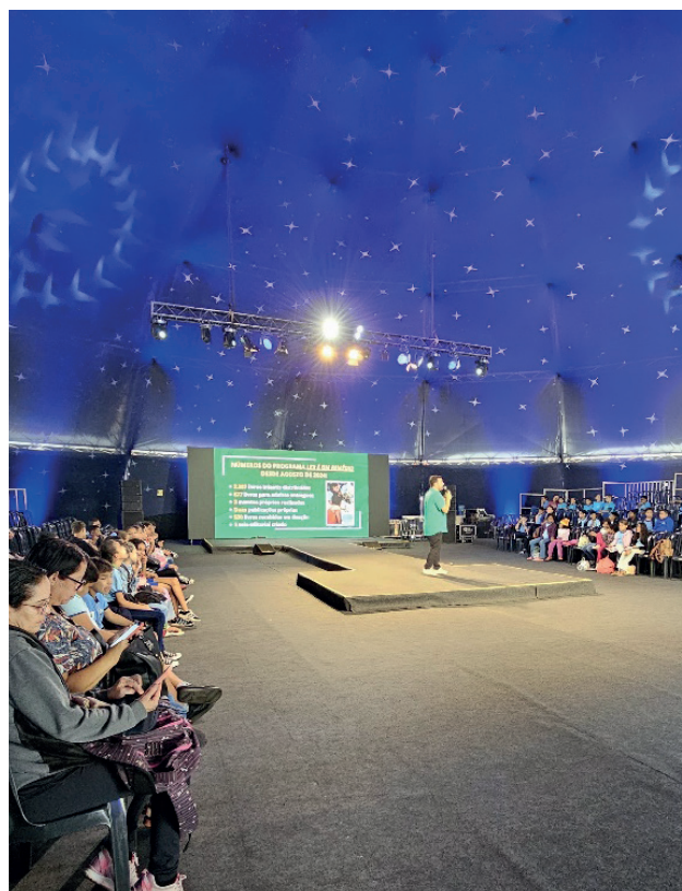
Espaço Sema, o principal palco da Feira