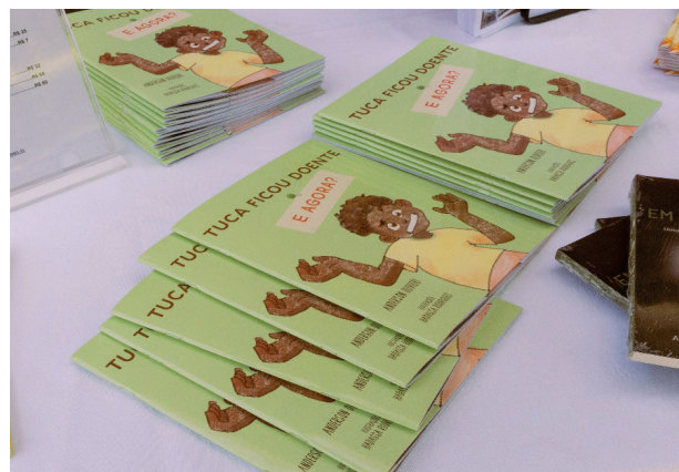
Lançamento do livro também marcou o nascimento da ACASE Publicações