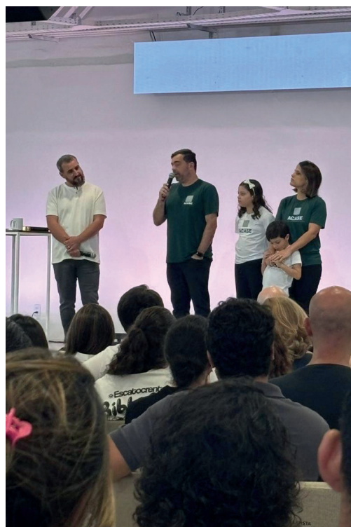
Fundadores da ACASE apresentam-na à Igreja