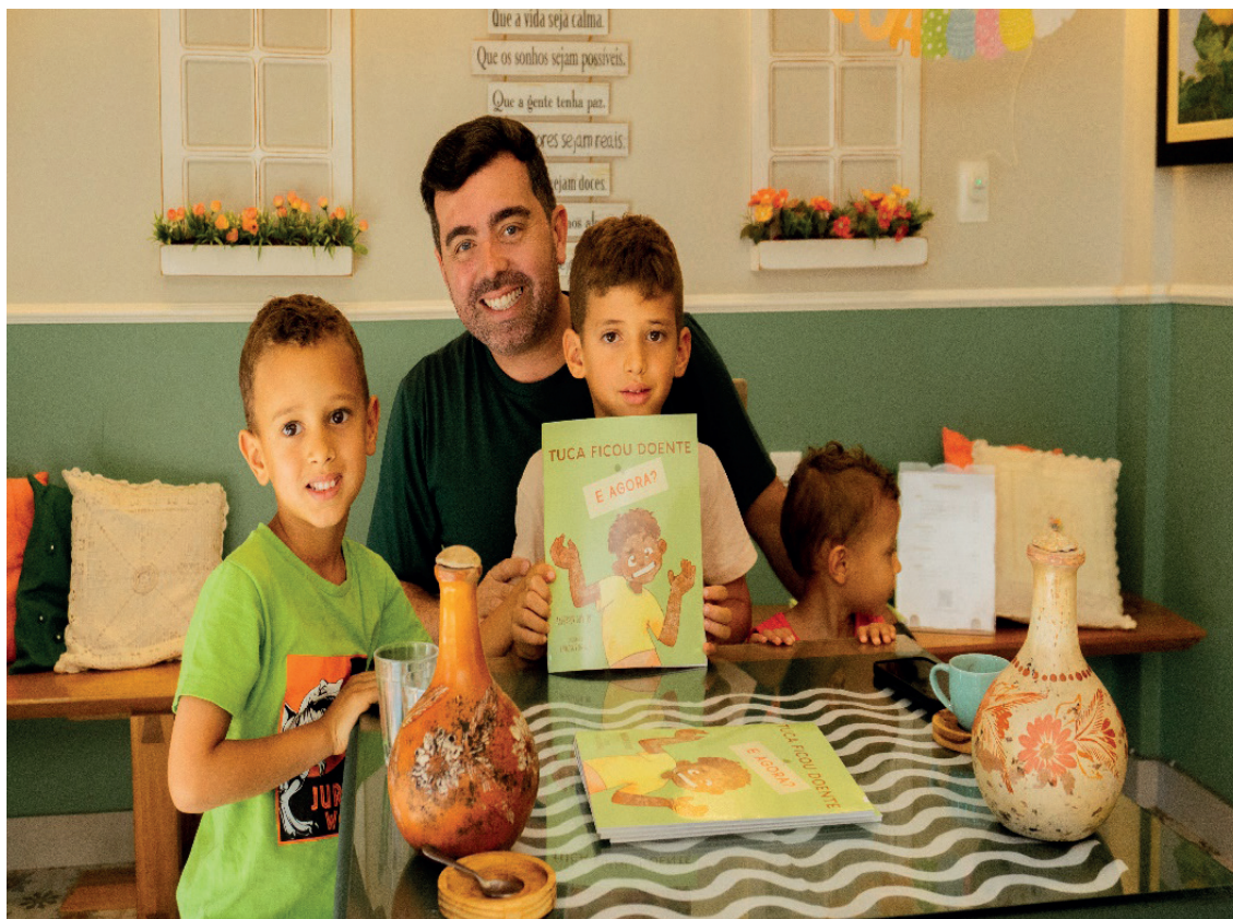
Autor recebeu o carinho das crianças