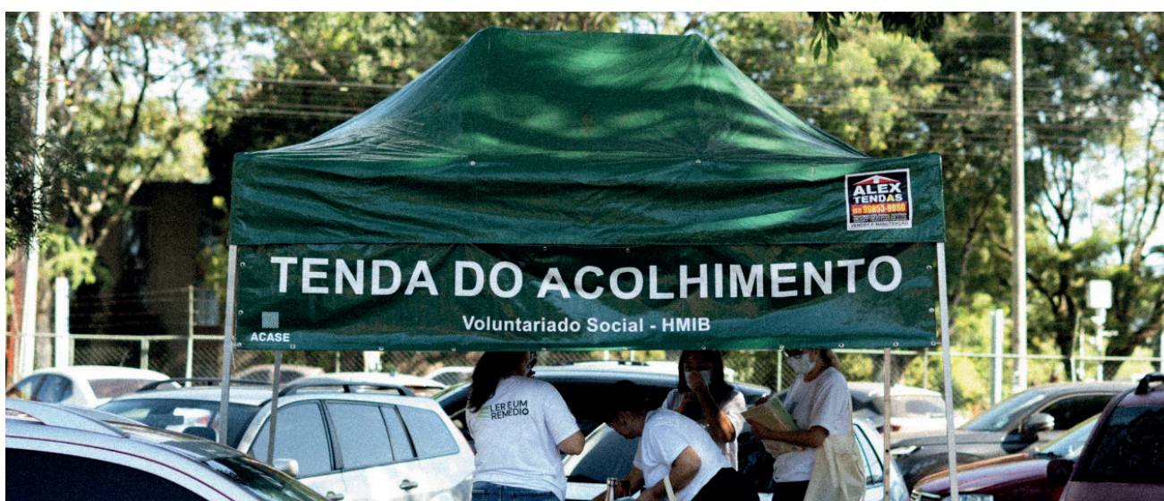
Atendimento ampliado em 2025: de um para três dias na semana