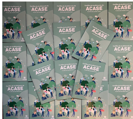
Cartilha distribuída aos voluntários em treinamento