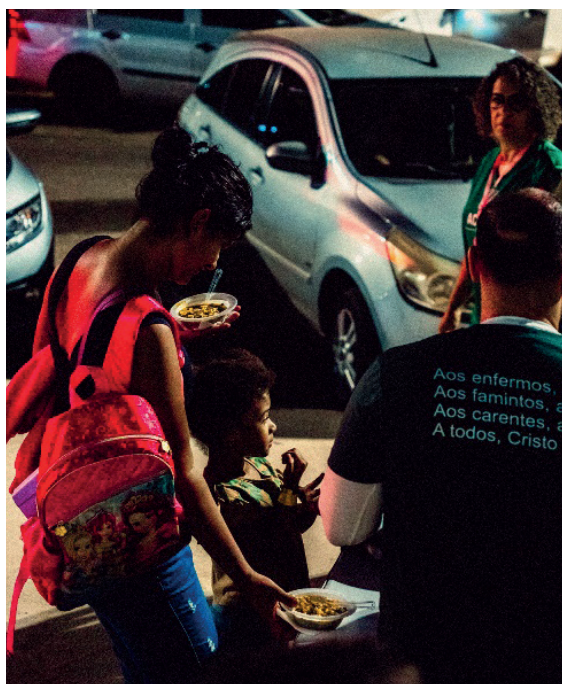
No partir do pão, a presença de Deus