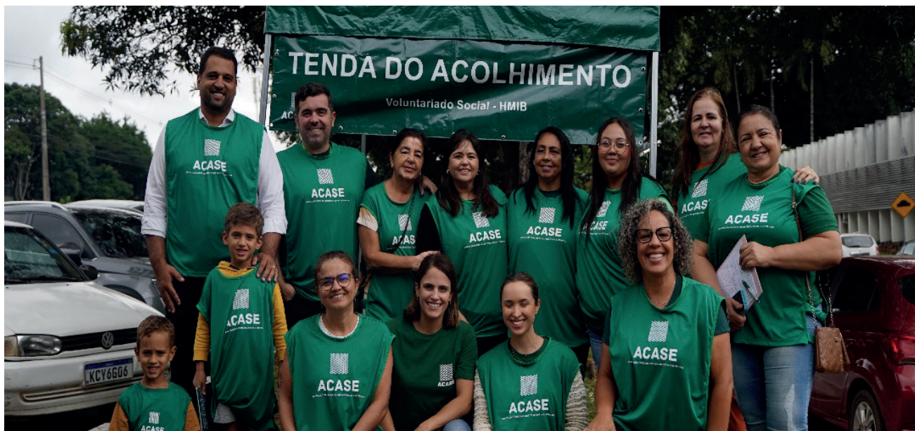
Ao longo do ano, 21 voluntários contribuíram com o serviço na Tenda