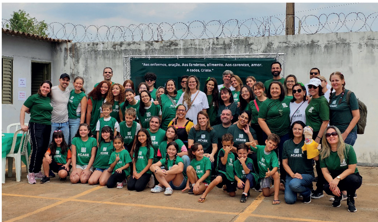
Voluntários da ACASE que serviram no Dia das Crianças