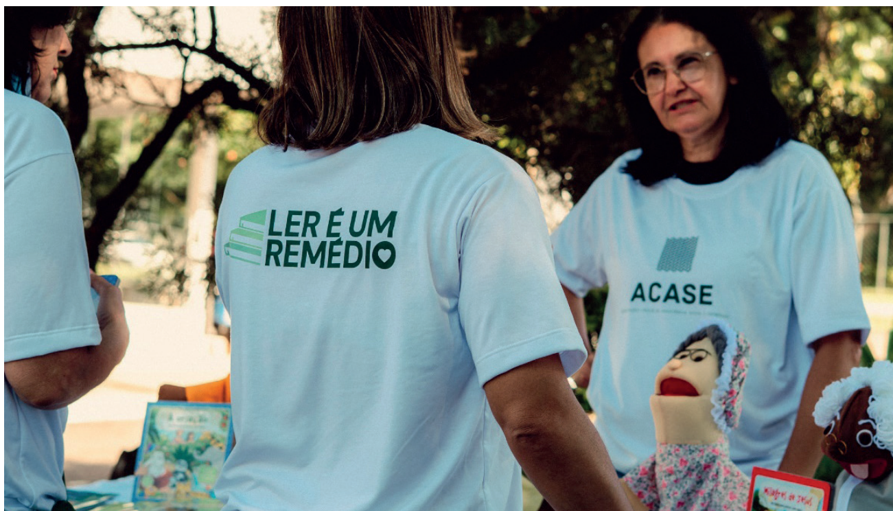
O programa conta com voluntários que vestem a camisa – literalmente